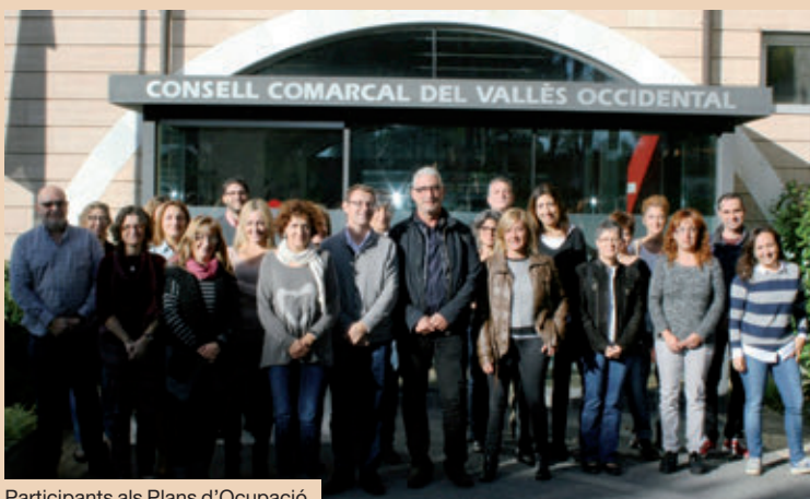
Participants als Plans d'Ocupació.

A través dels Plans d'Ocupació, el Consell Comarcal del Vallès Occidental ha contractat setze persones majors de 45 anys, inscrites com