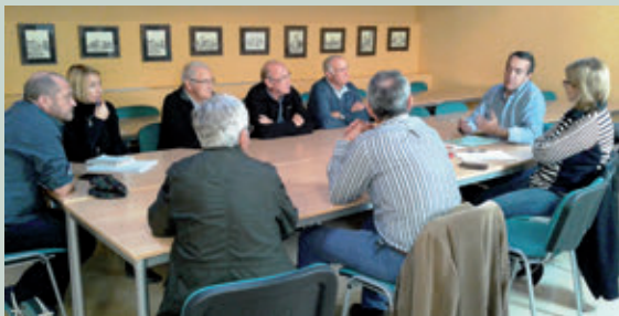
Reunió de l'Ajuntament de Vacarisses amb agricultors del municipi, tècnics de la Diputació de Barcelona i veterinaris.

Les regidories de Medi Ambient i Seguretat Ciutadana ja estan treballant per estudiar una proposta alternativa a la caça, ja que es considera una solució parcial. Un dels primers passos ha estat convocar una reunió amb els agricultors de Vacarisses, per informar-los d'un projecte de control dels senglars a través de vacunes per esterilitzar-los. L'explicació va anar a càrrec de tècnics de la Diputació de Barcelona i veterinaris.