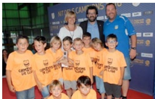
Prebenjamí. Futbol 7.