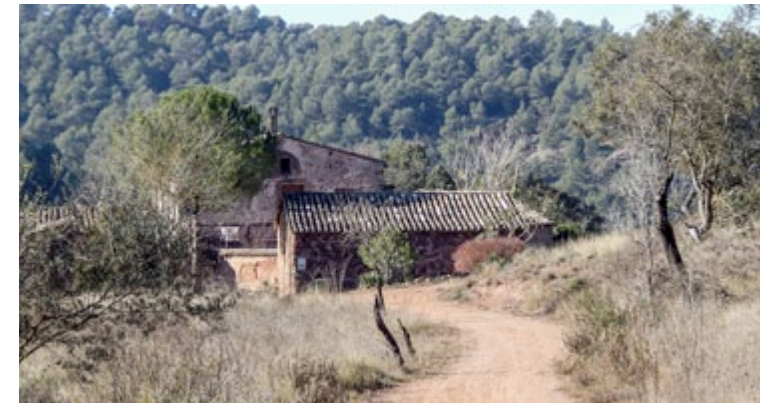
Masia de les Vendranes.