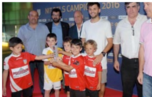
Prebenjamí. Futbol Sala.