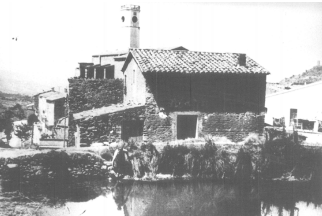
Cal Josepó i, en primer terme, la bassa del Castell. Any 1940. Font: Farrés Trias, J.M. (textos). Retrats de Vacarisses . Vacarisses: Ajuntament de Vacarisses, DL 1999.