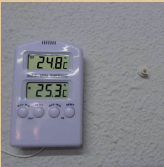
El control de temperatures als equipaments municipals ha estat una de les actuacions per l'estudi.

Tot seguit recollim algunes de les actuacions dutes a terme, amb una estimació de l'estalvi que han suposat.