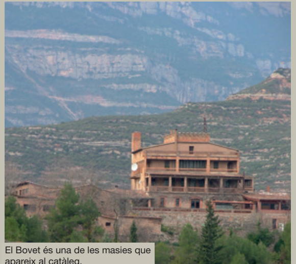
El Bovet és una de les masies que apareix al catàleg.

Així, el Pla contempla, en funció de l'estat de conservació de l'edifici, fer-hi unes actuacions i donar-hi sortides determinades: allotjament rural, restauració, apartaments... Segons ha explicat el Regidor d'Urbanisme, Martí Llorens, "la voluntat del Pla és dotar d'unes possibilitats, en funció del seu estat, per permetre l'activitat econòmica que ajudi a conservar el patrimoni, evitant-ne la degradació".